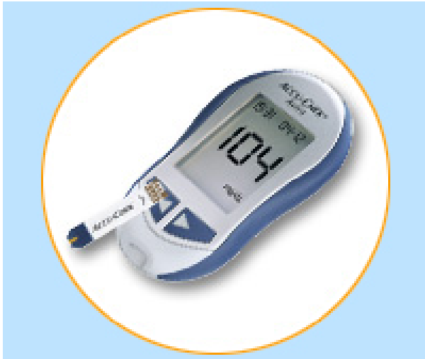
Abb. 1: Blutzuckermessgerät

\leq 140 mg/dl ( \leq 7,8 mmol/l) bzw. zwei Stunden nach dem Essen von \leq 120 mg/dl ( \leq 6,7 mmol/l).