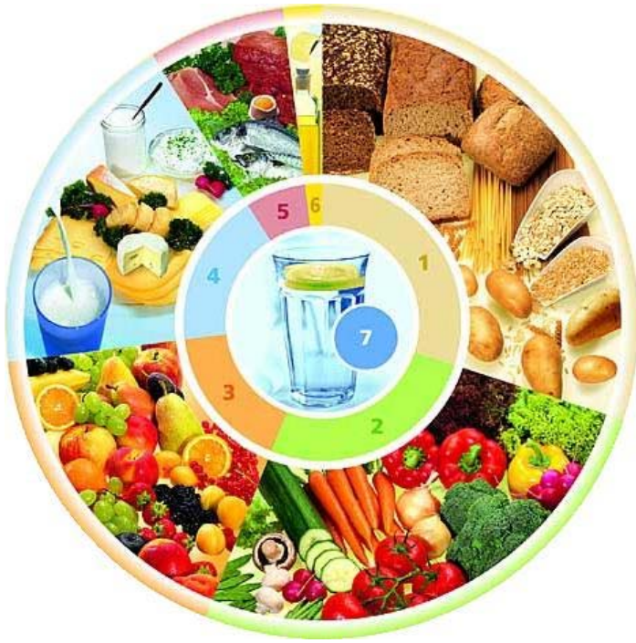
Abb. 2: Ernährungskreis

Schwangerschaft bedeutet nicht, für zwei essen zu müssen. Während der ersten Hälfte der Schwangerschaft ist der tägliche Energiebedarf nicht erhöht. Während der zweiten Hälfte sollten täglich etwa 100 - 300 kcal zusätzlich zugeführt werden, das entspricht etwa einer zusätzlichen Scheibe Brot mit Käse.